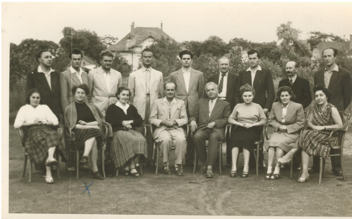
A gimnázium és a kollégium tanári kara a Bakér-parton (1957.)