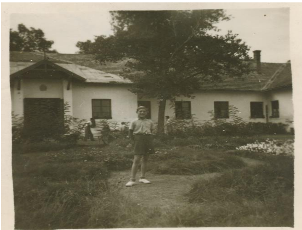
A belső udvar képe 1963. szeptemberében