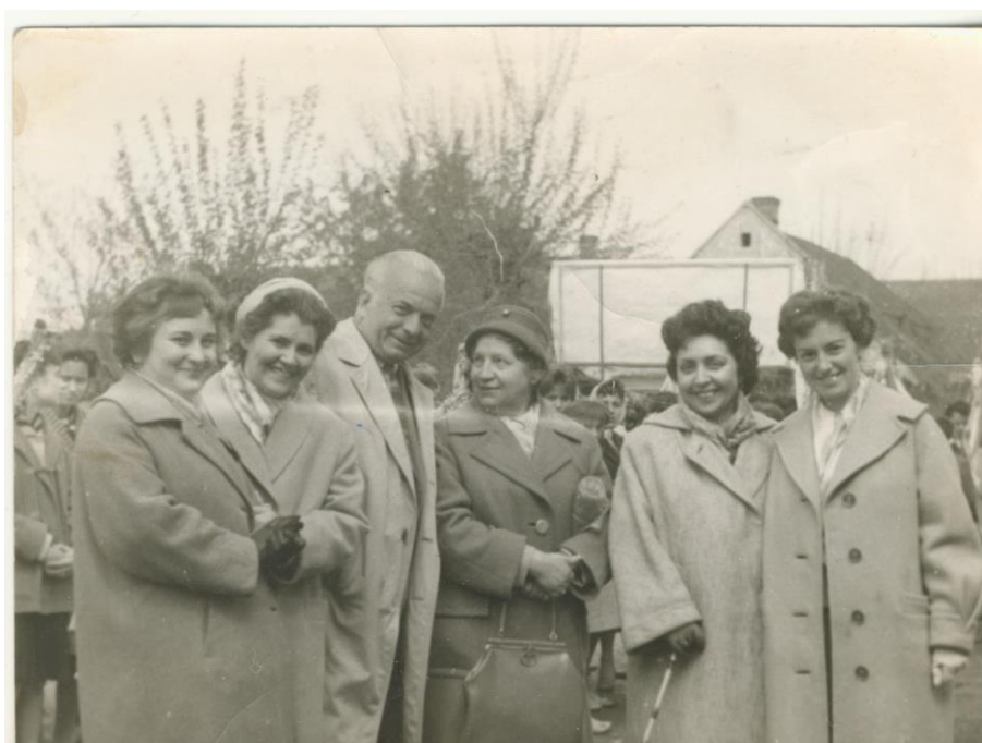
Gimnáziumi tanárok, fő- és mellékállású kollégiumi nevelőtanárok