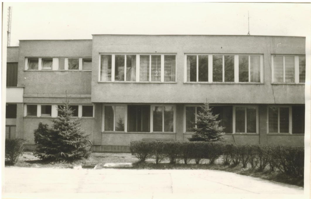
Az 1975 évben átadott új épületszárny