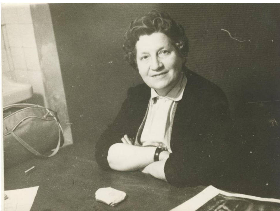
Az igazgatónő a kollégiumi íróasztalánál