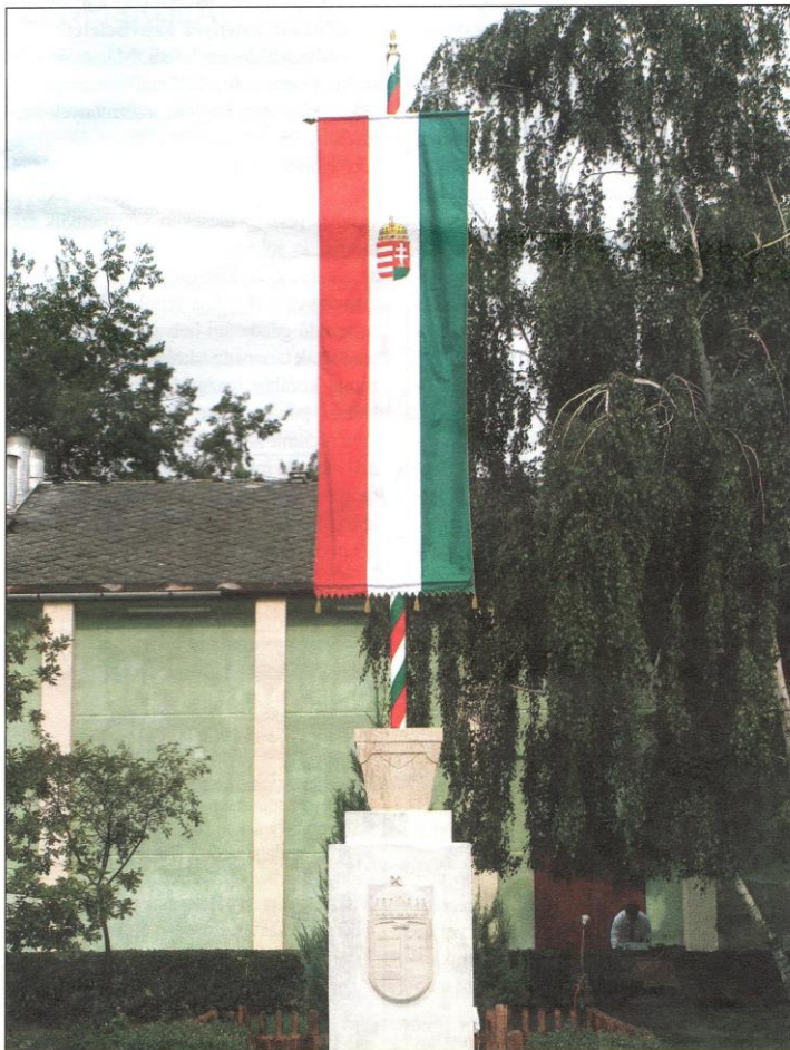
Augusztus 20-án Bódi Szabolcs avató beszédét követően Országzászlót lepleztek le a Kálvin téren. Az Országzászlóról bővebben szeptemberi számunkban írunk